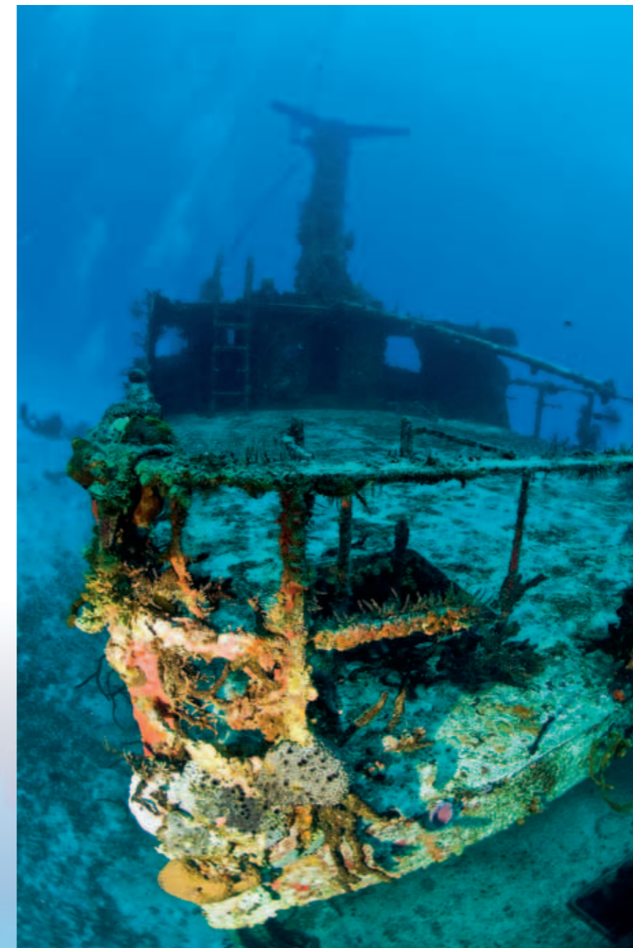
L'épave du Mama Vina

itaires, le tout dans des décors spectaculaires. Le sérieux briefing de notre instructeur et guide, nous permet de profiter au maximum de nos deux plongées et ce malgré les huit plongeurs de la palanquée. Le timing est serré pour ne pas rater le ferry... Sur le trajet de retour nous admirons le coucher de soleil sur la mer tout en écoutant un groupe local se produisant en live sur des musiques sud américaines...!