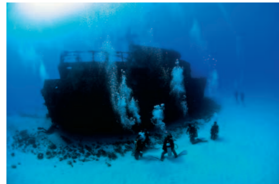
L'épave du Mama Vina

Troisième jour... En route dès le matin vers le port de Playa Del Carmen où nous prenons le ferry pour rejoindre l'île de Cozumel et sa réserve marine. Bascule arrière et nous voilà dans une eau cristalline. La visibilité est hors du commun «un régal pour moi, photographe» et comme annoncé, il y a un peu de courant. Une plongée dérivante entre des cayons dessinés par des roches couvertes d'éponges et de coraux, et ça et là des taches de sable blanc. Certes différent, pour des plongeurs rentrant d'Egypte, le site de Columbia Ladrillos avec une faune plus discrète permet, sur un fond de 27 m, des rencontres intéressantes pour qui sait regarder. Nous croisons, au cours de cette plongée tortues, langoustes, de nombreux poissons de récifs ainsi que quelques grands barracudas soli-