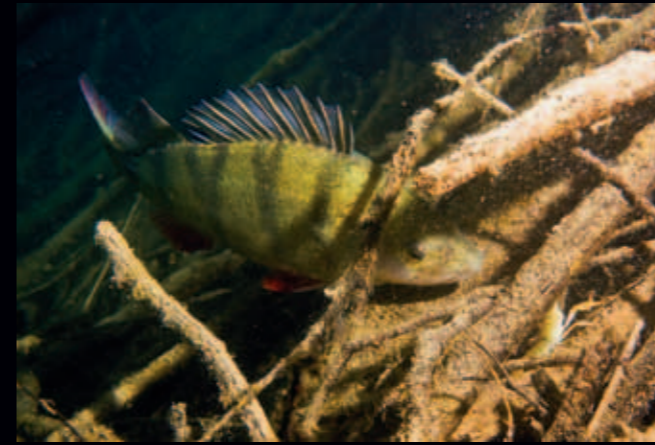
Perca vs Astacus